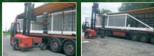
Livraison et déchargement du portail