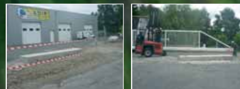
Mise en place sur le socle