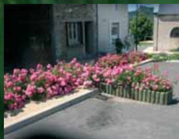
Bourg de Lavoine