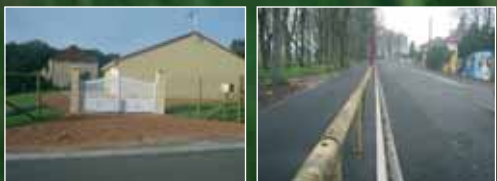
Bellerive sur Allier