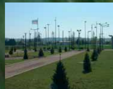
Valmont - Charmeil