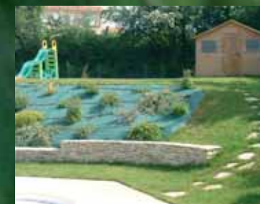
Particulier - Cusset