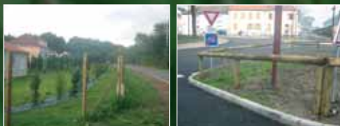
Clôture bois à Commeny