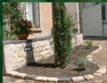
Particulier - Varennes/Allier