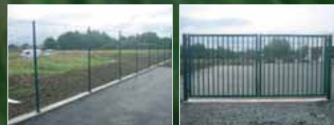
Groupe scolaire de Brugheas